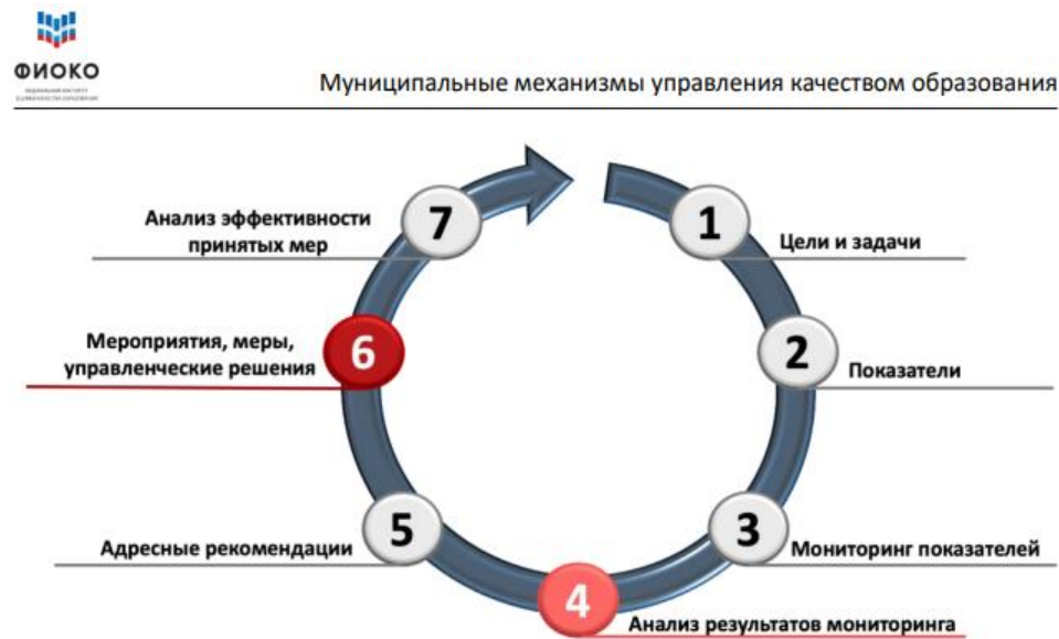
Рисунок 2 – Структура управленческого цикла. Цветом выделены элементы цикла, актуальные для всех управленческих направлений, реализуемых на уровне муниципалитета

Позволяет установить эффективность управленческой работы МОУО по направлениям работы характерным именно для муниципального уровня.