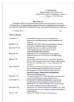
Протокол совещания от 15.11.2021.pdf