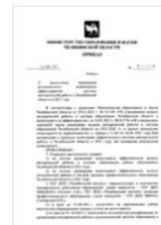
Приказ 1649_МР результат...торинга.pdf