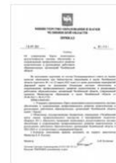
Приказ 881_Карта ДППО.pdf