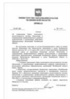
приказ 881_карта мониторинга.pdf

Размещение на Яндекс.Диске в папке «Документы и материалы»